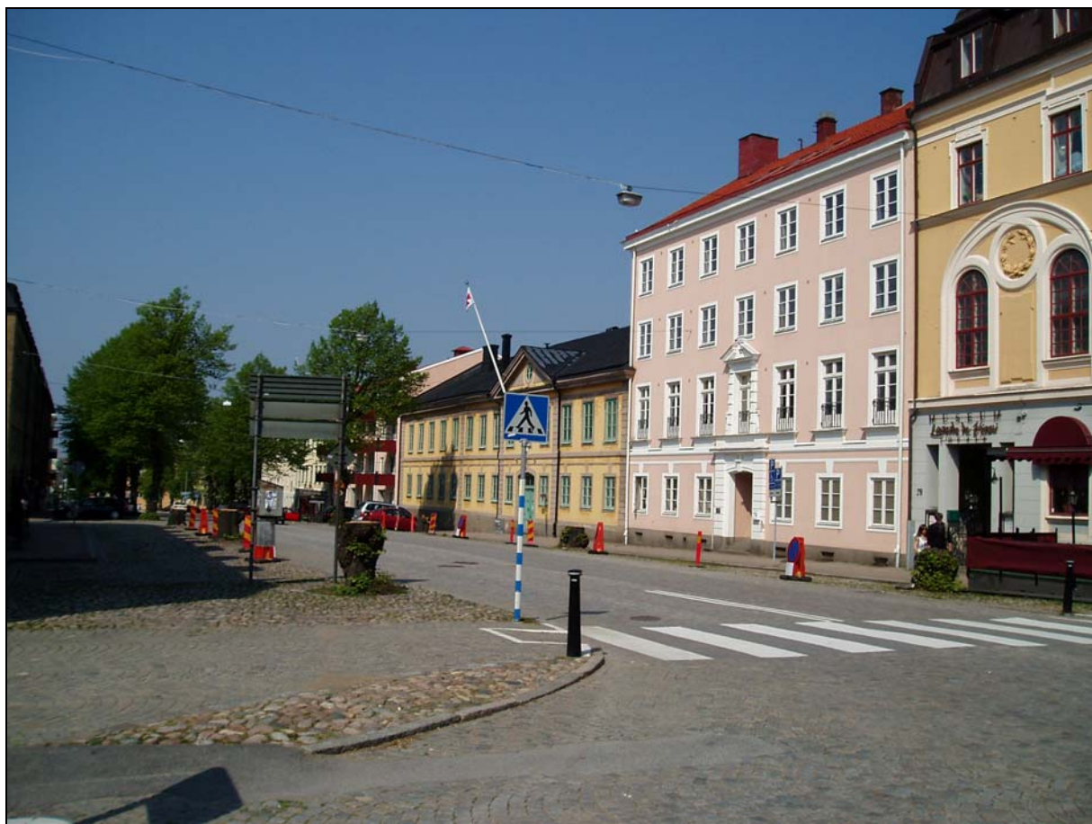
Bilaga 1b – Aktuellt parti av Drottninggatan fotograferat mot NO.