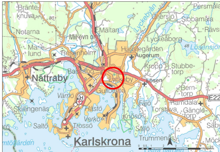
Fig.1 Utredningsområdet markerat på Översiktskartan