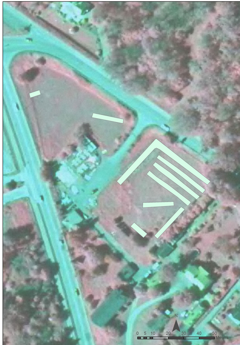
Fig.2 Utredningsschakten markerade på Fastighetskartan