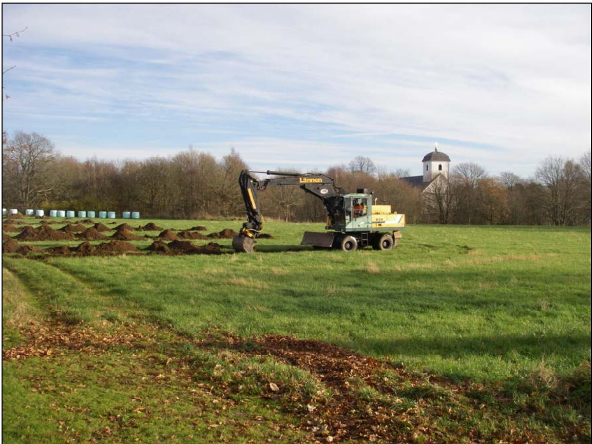
Bilaga 1b – Söschaktning inom utredningsområdet, fotograferat mot SO.