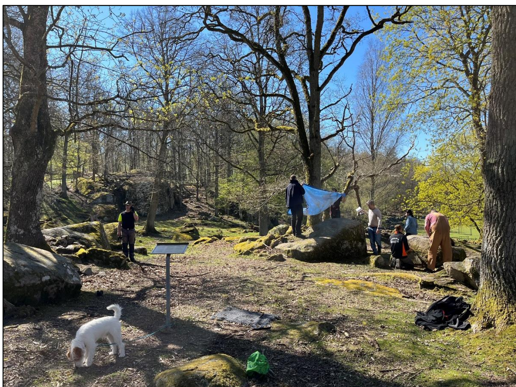
Fig.3 – Pågående dokumentationsarbete vid offerlunden i Halahult. Rengöring av block utförs parallellt med skanning av ristade ytor.

Inledningsvis rengjordes stenblocken i offerlunden mekaniskt, genom försiktig skrapning och borstning. Härfter utfördes digital skanning av de ristade ytorna såväl som stenblockens absoluta närområde. Eftermiddagen ägnades slutligen åt genomsökning av löst liggande stenar tillsammans med hembygdsförening och skola. Stenmaterialet lyftes temporärt från tre i förhållande till ristningen närliggande röjningsrösen (bilaga 2), varvid detta undersöktes okulärt. Slutligen lades stenarna i möjligaste mån tillbaka i ursprungligt läge. Förmedling av platsen bestod i huvudsak i att Magnus Källström presenterade platsens betydelse och runornas innebörd för såväl skolbarn som lokalboende.