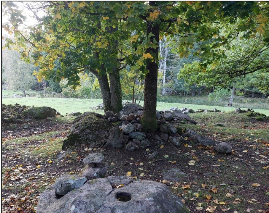
Röhningsröse 2, beläget 6 m V om ristningen