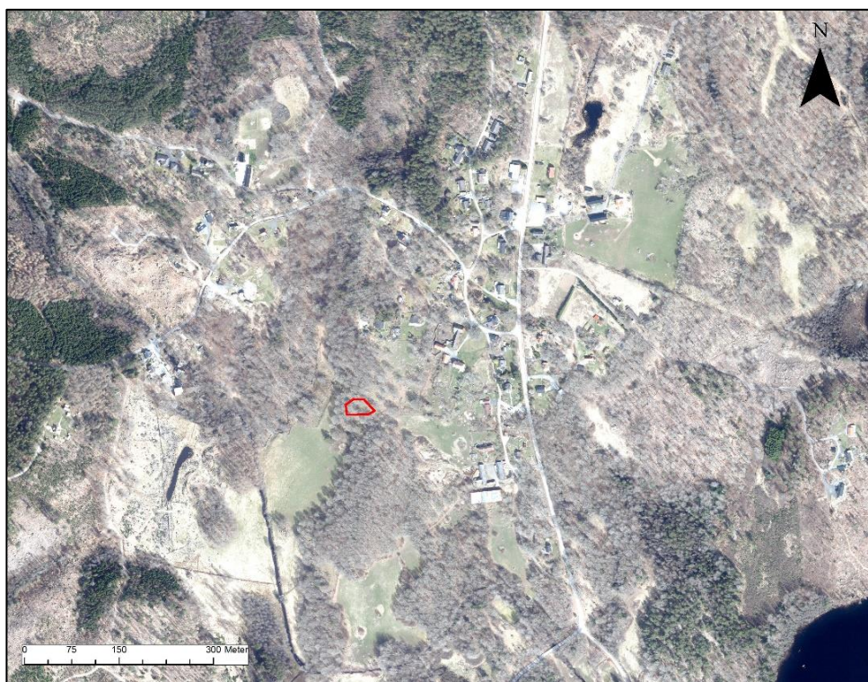
Fig.2 – Fastighetsgränsen tillika förundersökningsområdet markerat som röd polygon på Ortofotot.

knutna till sen historisk tid. Den aktuella lämningen RAÄ Åryd 58:1 (L1979:6205) utgörs av fem stenblock på vilka inristade figurer i form av slipmärken, tassar och fotsulor samt en runslinga finns. En folklig tradition har återkommande velat placera ristningarna i ett forntida skede, men antikvariskt brukar de i dag snarare dateras till ett eftermedeltida skede (Erlandsson, K.-O. 2022). Runverkets detaljstudier av det 2022 funna fragmentet gav en tydlig bekräftelse på att runristningen utgjorts av 19 runor, i överensstämmelse med nyttjandet av så kallade Gyllentalsrunor och den tradition som kan knytas till bruket av runstavar (muntligen Magnus Källström).