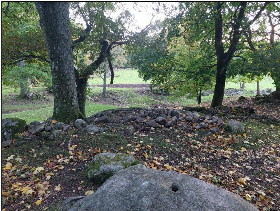
Röjningsröse 1 (röset med det nyfunna fragmentet), beläget 3,7 m SV om ristningen