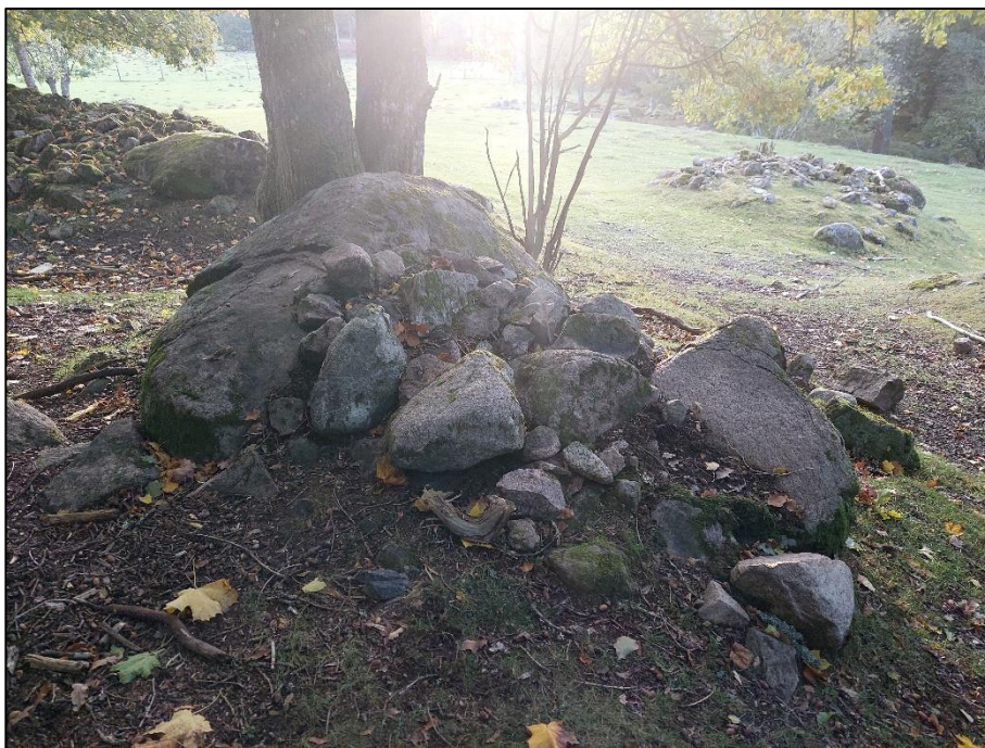
Röhningsröse 3, beläget 10 m VNV om ristningen