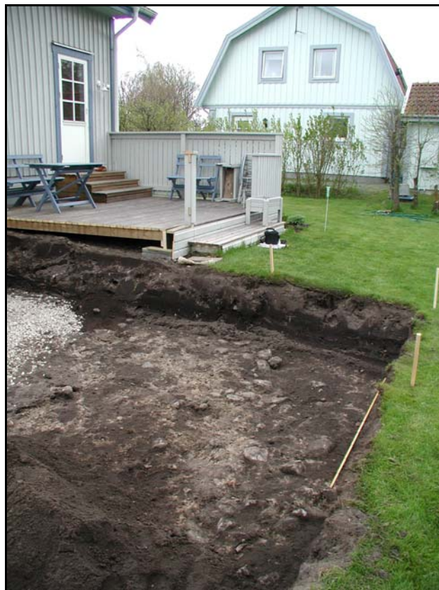
Fig.1 – Framrensad del av exploateringsytan mot S.

Utifrån de i samband med undersökningen gjorda observationerna gjordes bedömningen att inga antikvariskt känsliga eller intressanta delar av RAÄ 222 berördes av det planerade markingreppet.