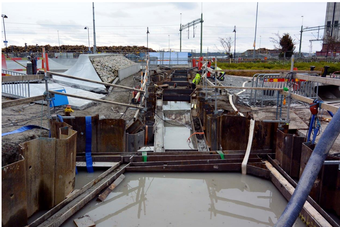
Fig.2 – Översvämmat schaktavsnitt fotograferat mot SSO.