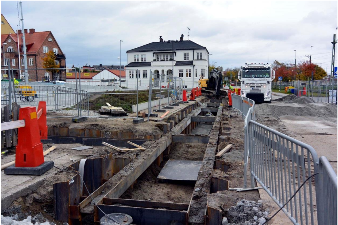
Fig.3 – Schaktavsnitt mot ONO.