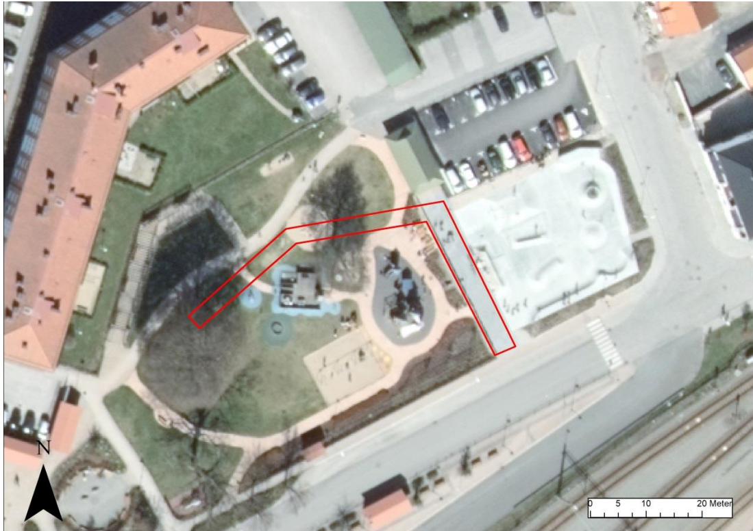
Fig. 1 – Övervakat schaktavsnitt rödmarkerat på ortofotot.