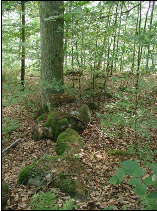
Fig.2 – Miljöbild med stenmursrest inom utredningsområdet.

gamla Riksvägen. Av kulturhistoriskt intresse i den kringliggande miljön är dessutom ett antal s.k. knackestenar, troligtvis nyttjade för makadamframställning i samband med AK-arbetena under 1920- och 30-talen.