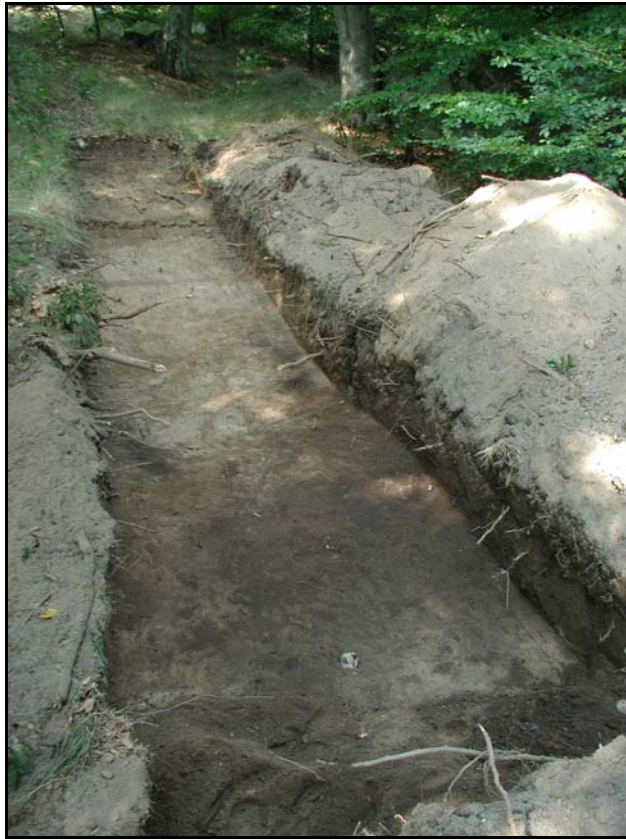
Fig.3 – Sökschakt 1 mot N med bevarade anläggningar och kulturlager.

Sökschakt 1 placerades i N-S riktning i sluttningen ner mot Riksväg 4. På 0,30 m djup framkom en vit till gulbrun, havspåverkad moränsand. I den södra delen av schaktet påträffades ett antal sotiga fläckar samt ett gråaktigt, träkolsbemängt och delvis fyndförande sandlager på 0,35 m djup (se fig. 3). Hur detta kulturlager sträckte sig framgick inte vid schaktningen, men det föreföll fortsätta i östlig riktning. Fynd i form av såväl avfall som avslag av kvarts och flinta tillvaratogs vid schaktningen. I huvudsak framkom dessa i det överlagrande, humösa jordlagret, men åtminstone ett avslag kunde knytas till kulturlagret (se fig.4)