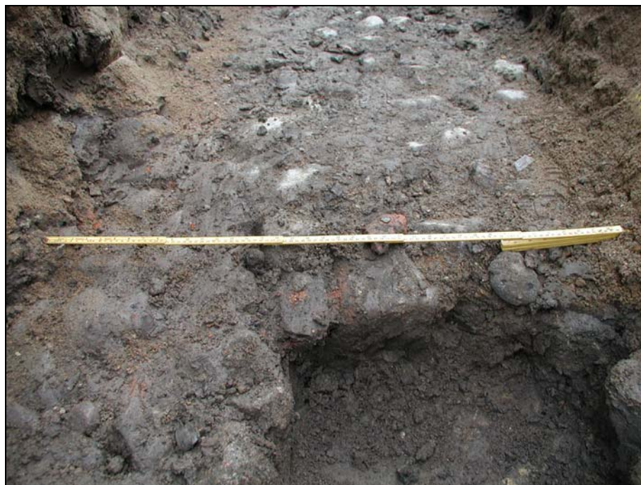
Detalj av framrensad, stenlagd yta i Schakt 1, Prinsgatan.