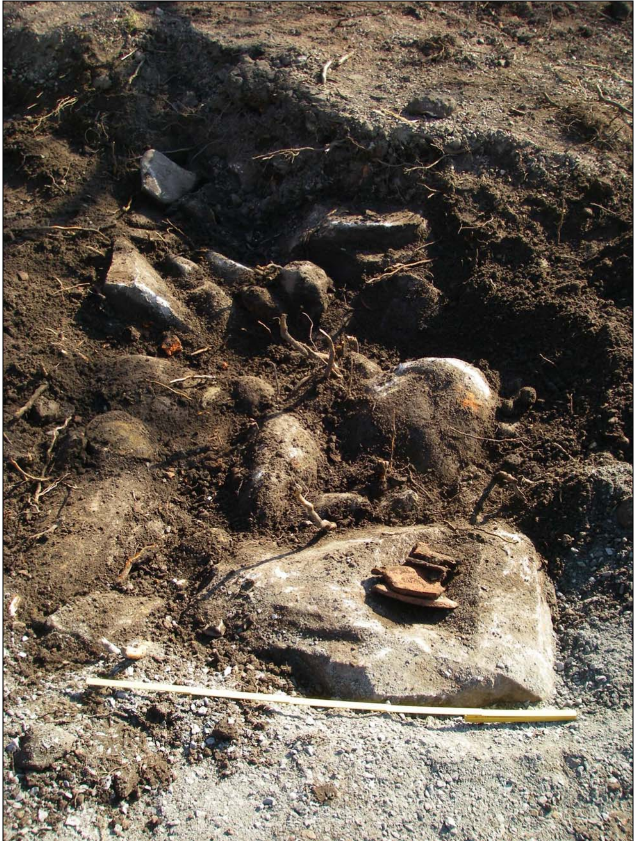
Nordligaste delen av den framrensade murresten, överblick mot N.