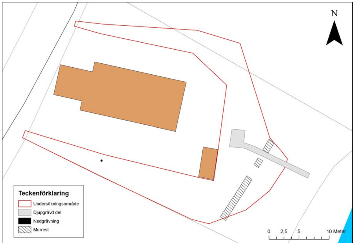
Schaktplan arkeologisk förundersökning.