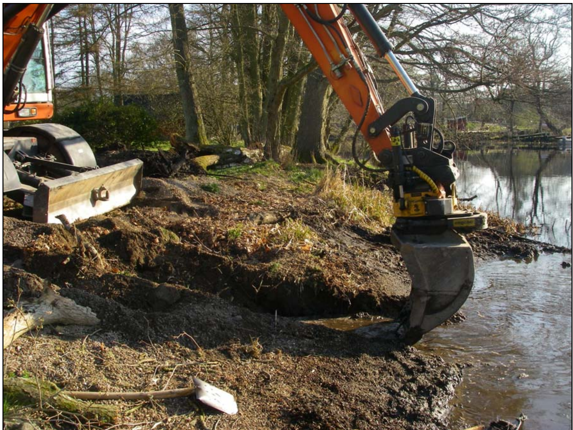
Inledande schaktning från åsidan, överblick mot N.