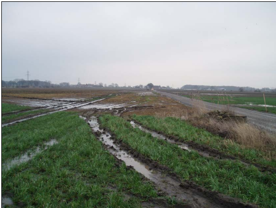
Exploateringsområdet fotograferat över Punkt 1 mot Ö.