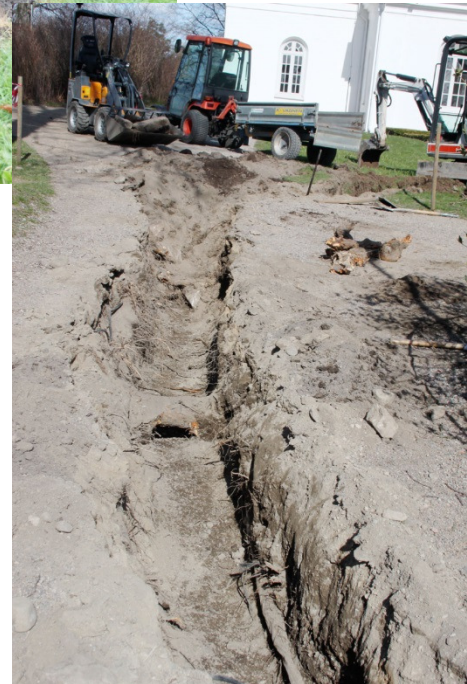
Fig 4 Del av schakt. Foto mot NNO