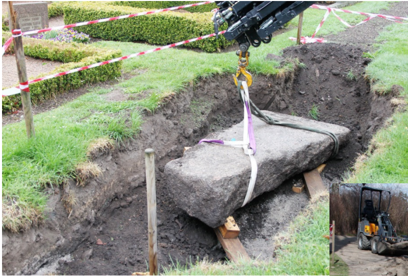
Fig 3 Lösens kyrka, stenlyft