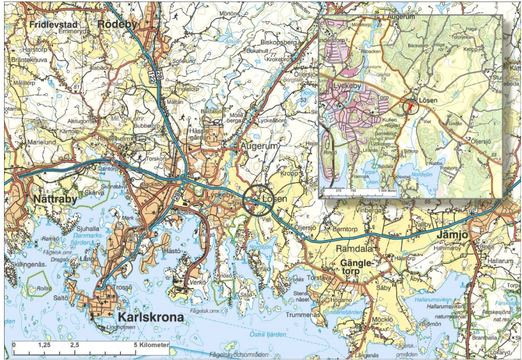
Fig 1 Undersökningsområdet markerat på Vägkartan resp Terrängkartan