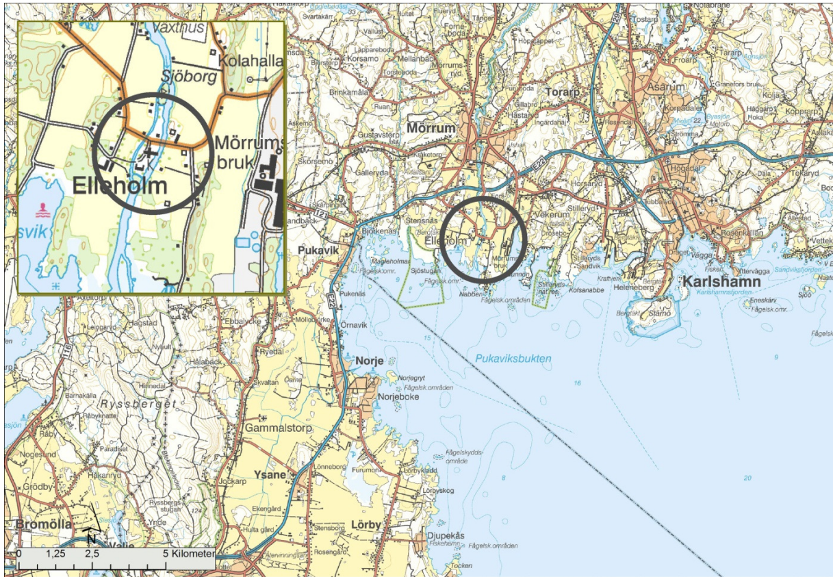
Fig.1 Undersökningsområdet markerat på Vägkartan resp. Terrängkartan