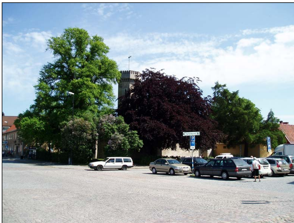
Bilaga 1b – Vattenborgen våren 2007, fotograferad mot SO.