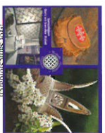
Sven-Åke Risfjells hans färdoris i detta sameslöjdgalleriet med