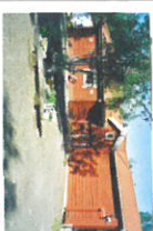
Världens största samekniv